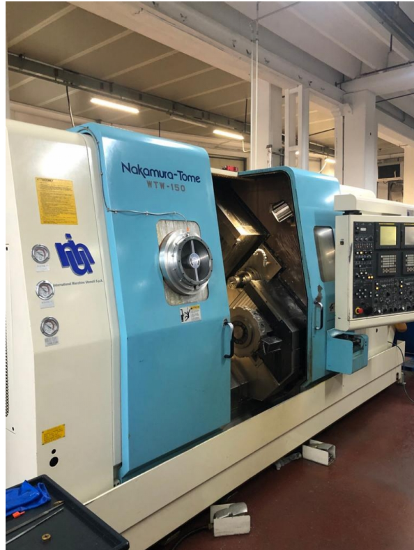
Foto zona di lavoro