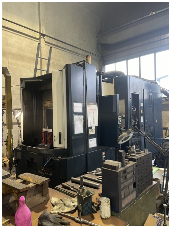
Foto pannello di controllo