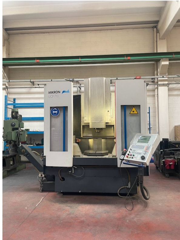
Foto zona di lavoro