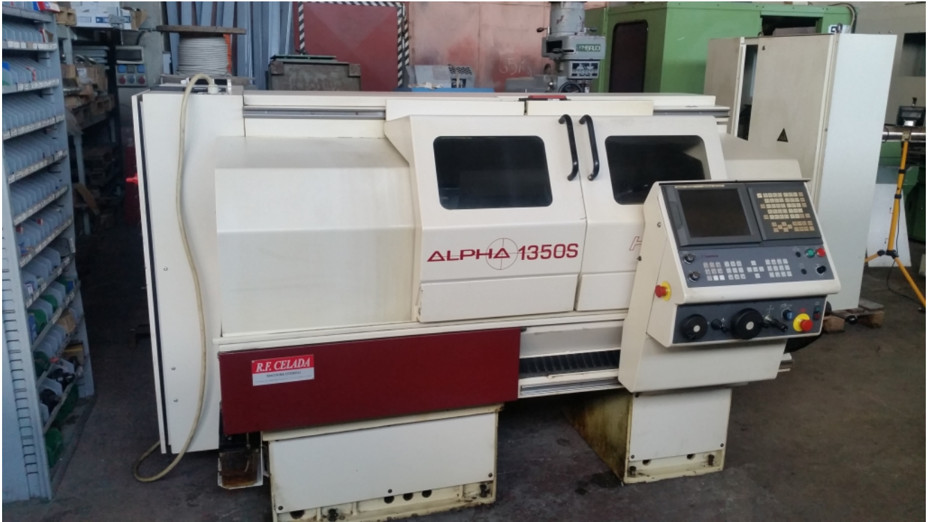
Foto zona di lavoro