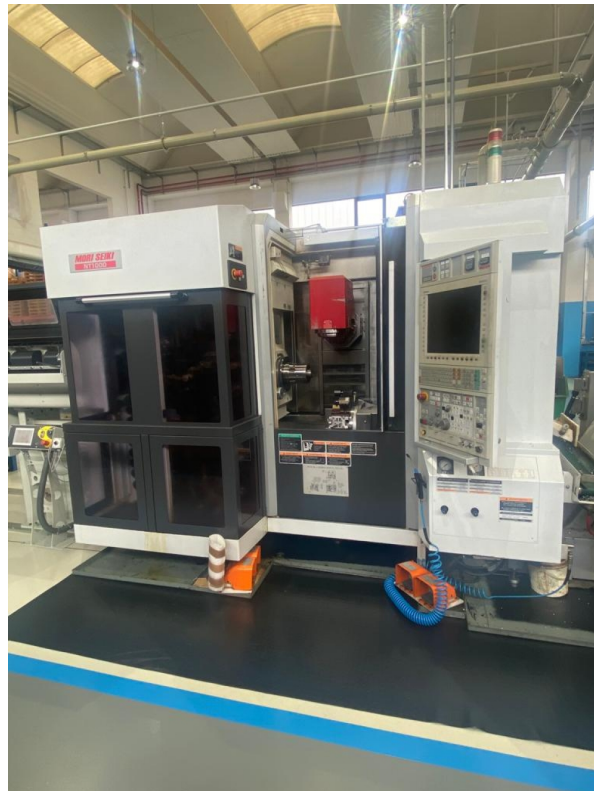
Foto zona di lavoro