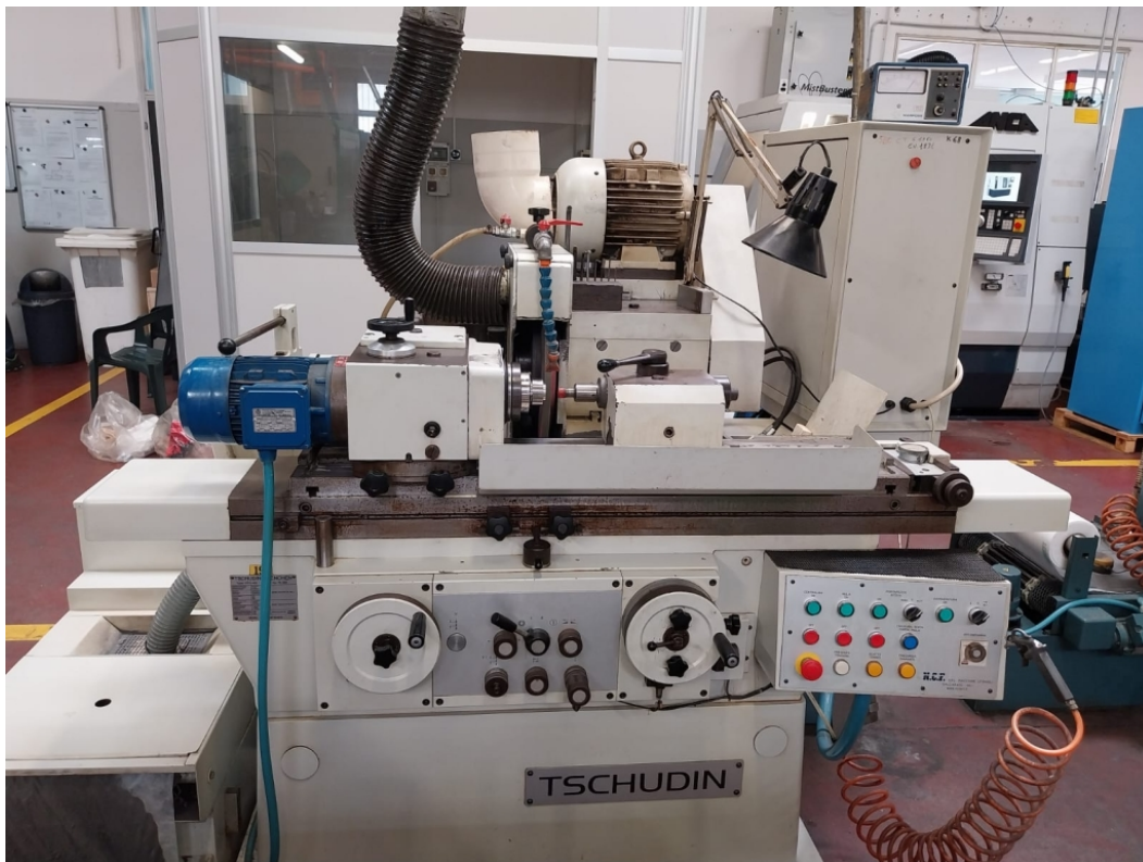
Foto zona di lavoro