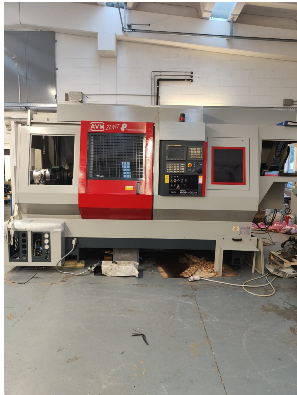
Foto zona di lavoro