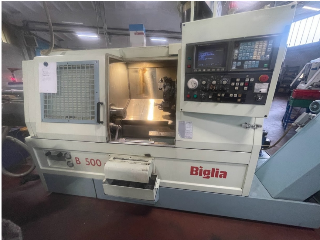
Foto pannello di controllo