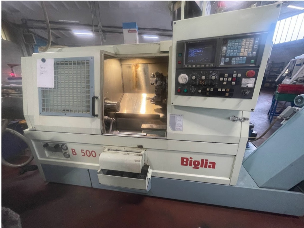
Foto pannello di controllo