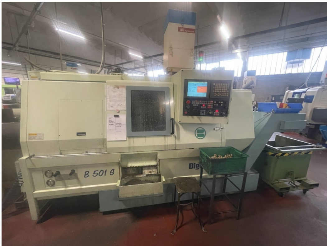
Foto zona di lavoro