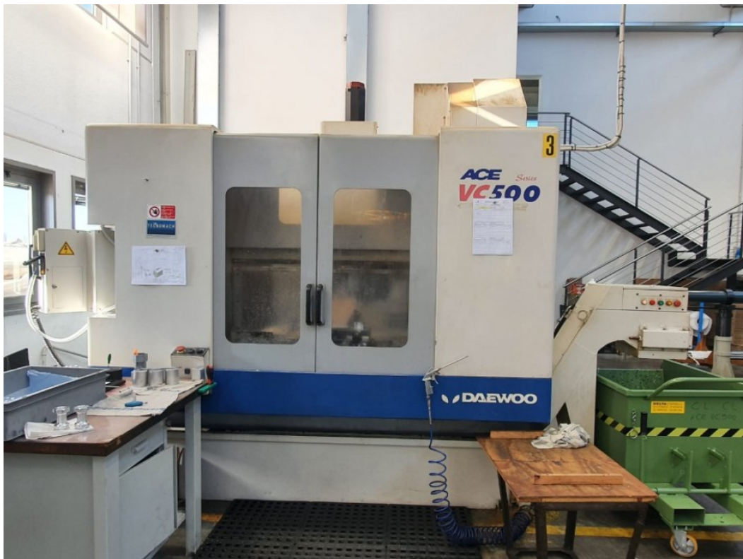
Foto zona di lavoro