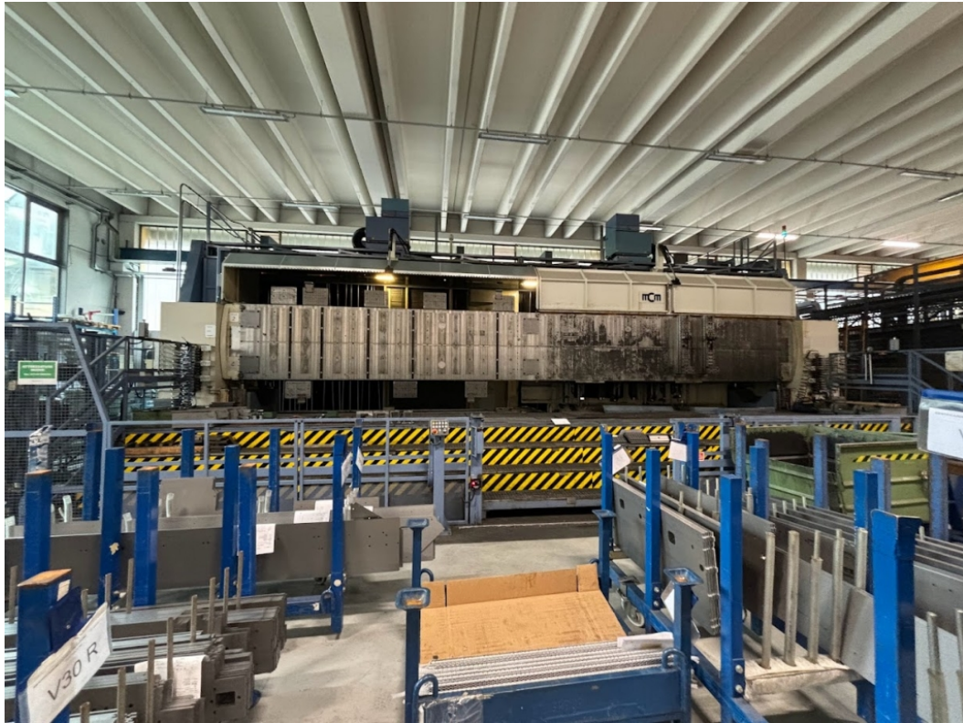
Foto zona di lavoro