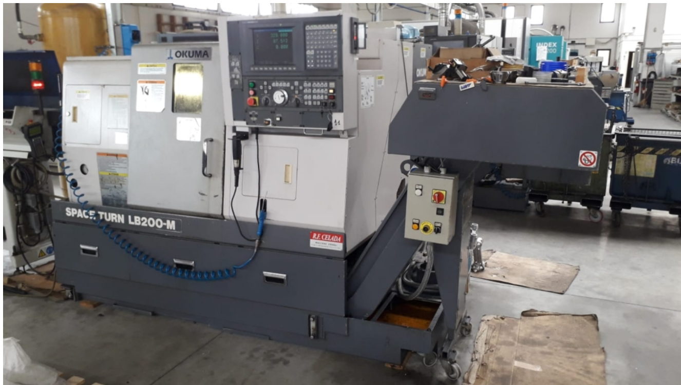
Foto zona di lavoro