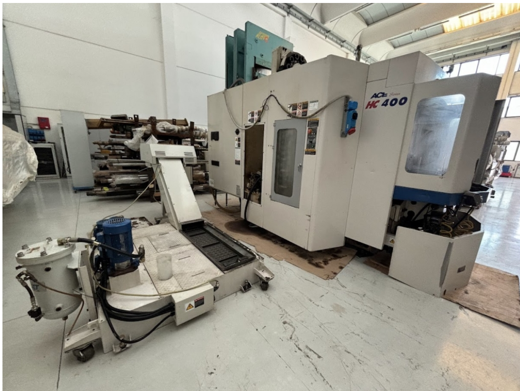
Foto zona di lavoro