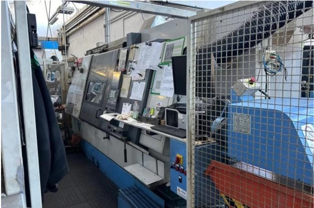
Foto zona di lavoro