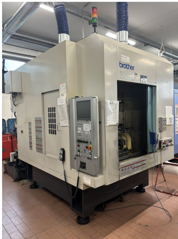
Foto zona di lavoro