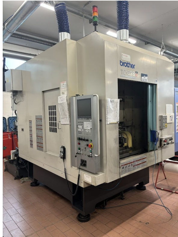
Foto zona di lavoro