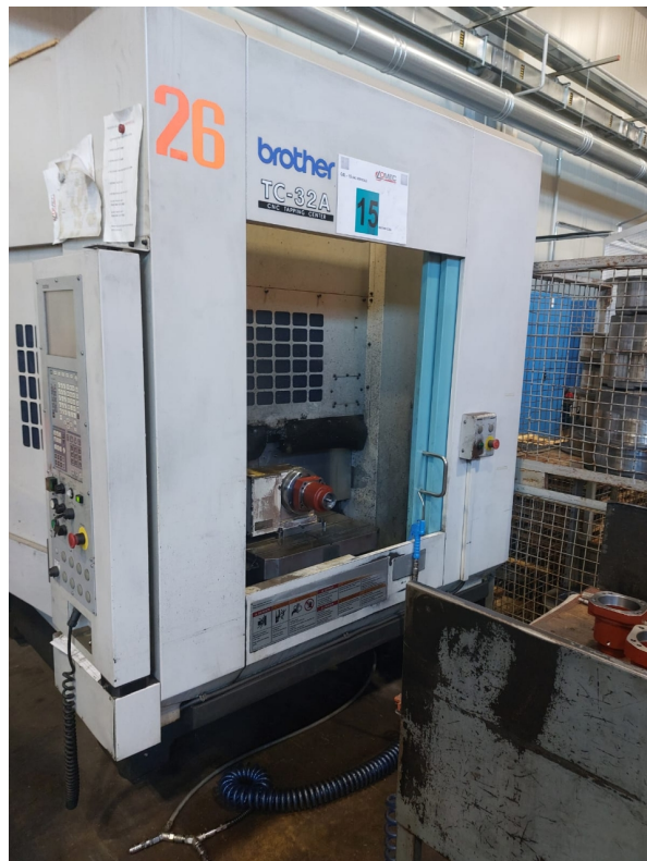
Foto pannello di controllo