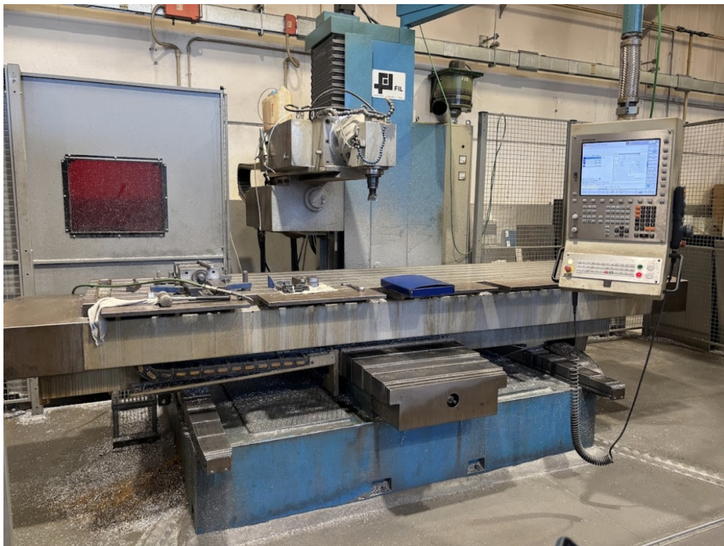
Foto zona di lavoro