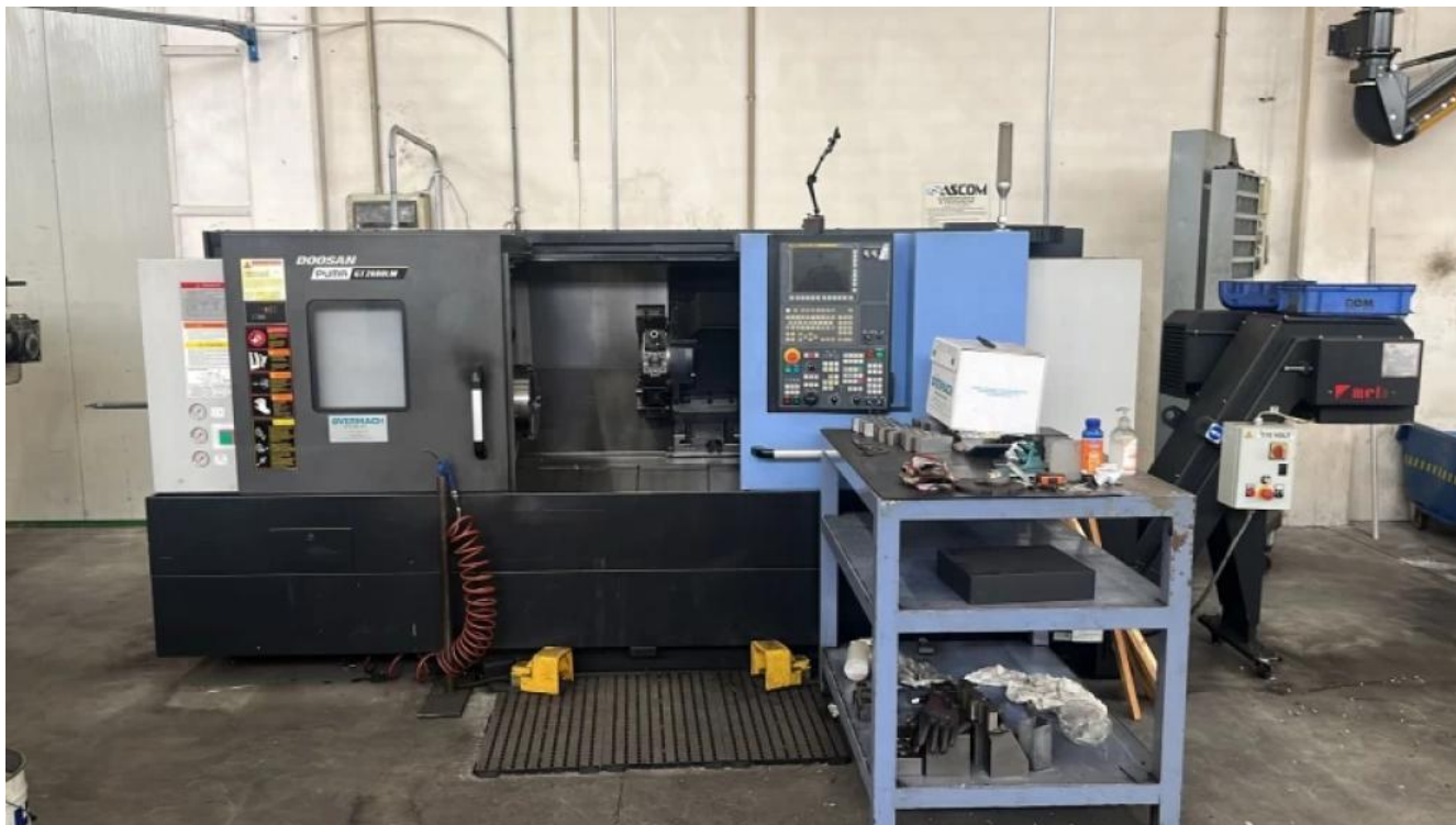
Foto zona di lavoro