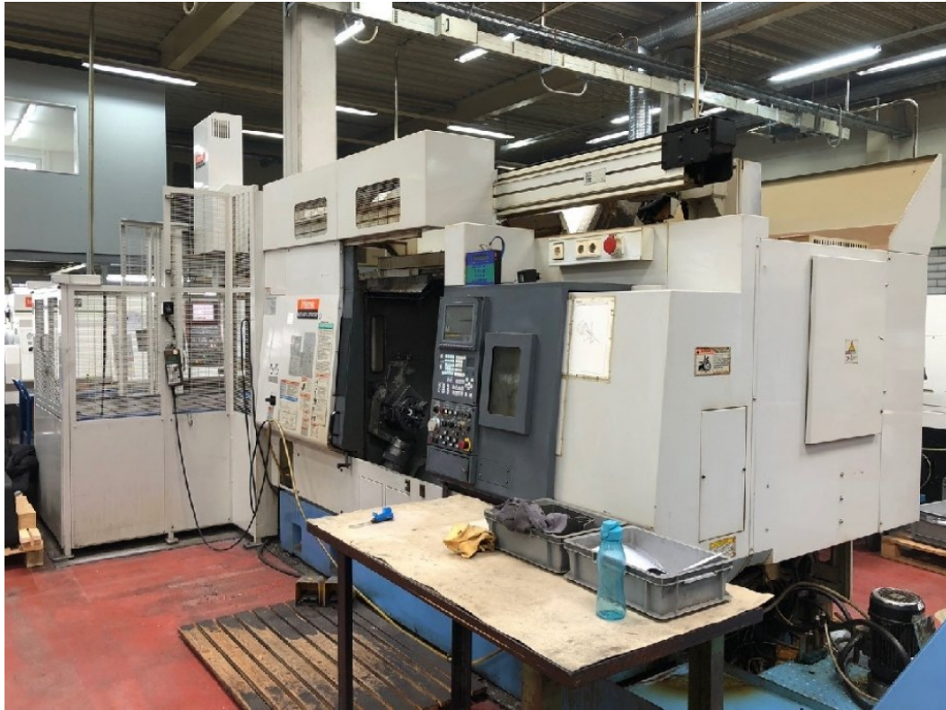
Foto zona di lavoro