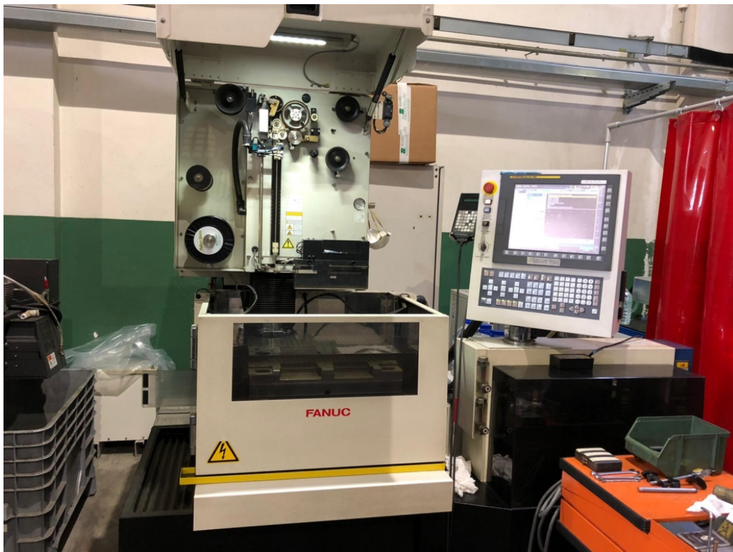
Foto zona di lavoro